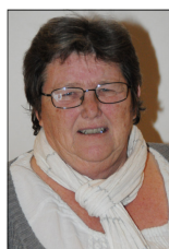
Motionsklubben for Askerødder