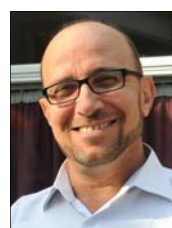
Mens Salon Abdulkareem