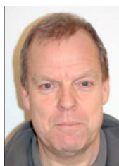
Driftasst.: Brian Olsen