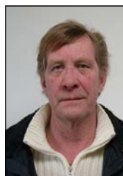
Billardklubben Jon Vestergård