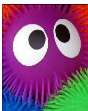
Power Sport Amer Ghani