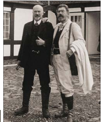
Michael Ancher og PS Krøyer

Michael Ancher: Selvportræt, 1902. Statens Museum for Kunst.