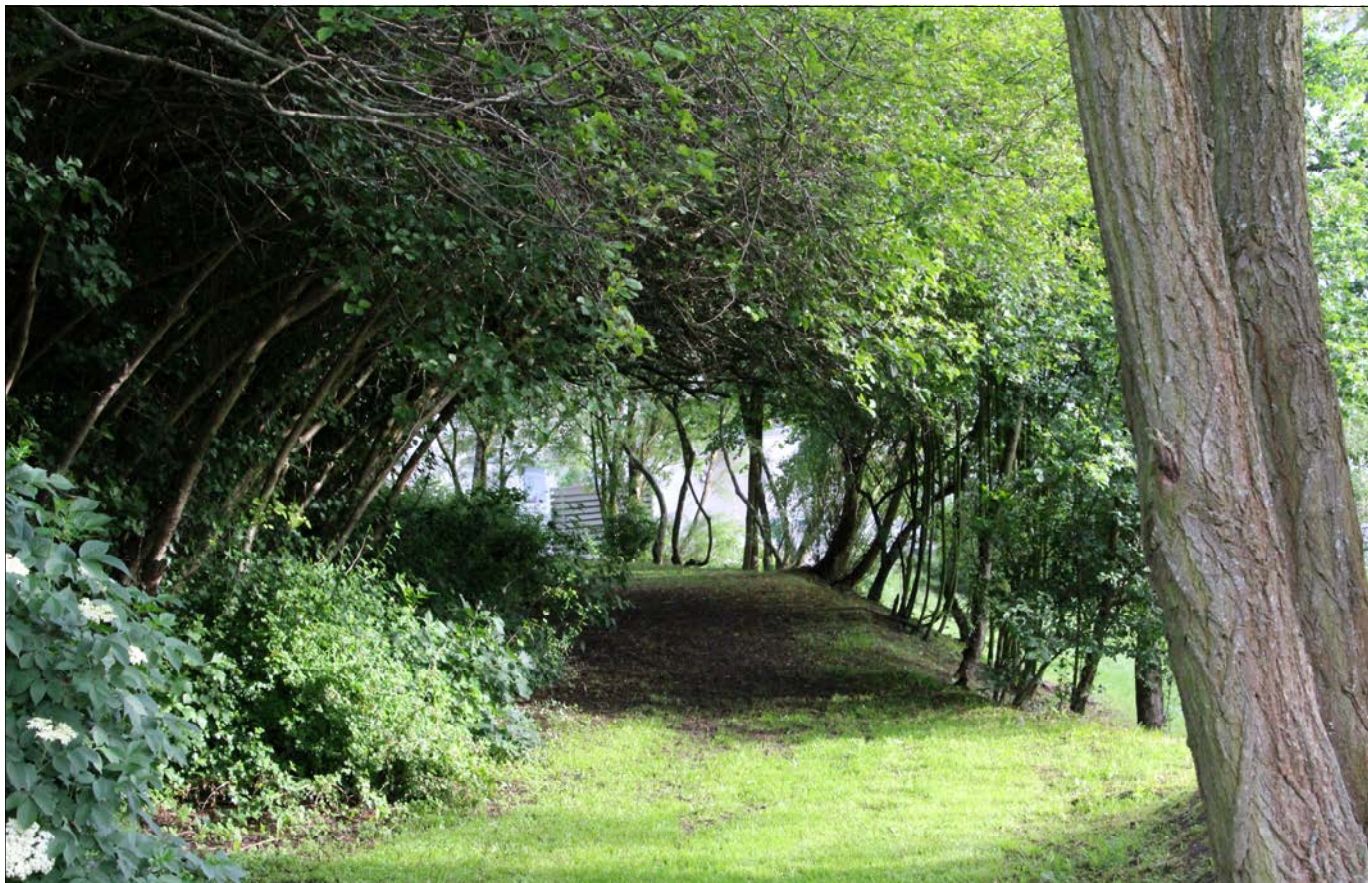
Billedet: Vores dejlige Askerød