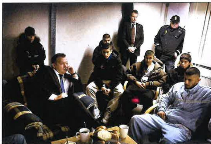
Besøg af daværende statsminister Lars Løkke Rasmussen i kælderens under Stamhuset. Billedet blev kåret som årets presfoto 2011.