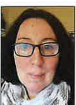
Redaktør: Charlotte Birkved